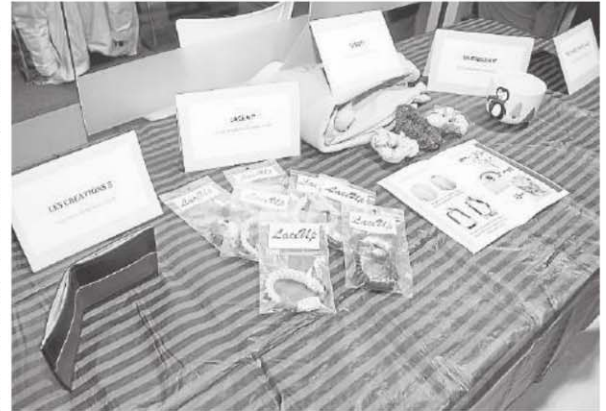
Des vêtements, des bracelets, des accessoires pour les cheveux, des tables, des horloges, un service de recyclage, etc. Il y en a pour tous les goûts dans le cadre du programme des Jeunes entreprises.